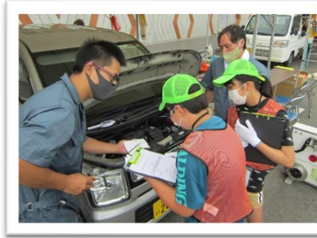
1. エンジンルーム、車まわりを点検

当日、会場である陸前高田市コミュニティーホールには地元の小学生約60人が集まり、23業種の地域企業の参加により、職業体験→仮想通貨の交付→消費体験 という流れでイベントが進められました。