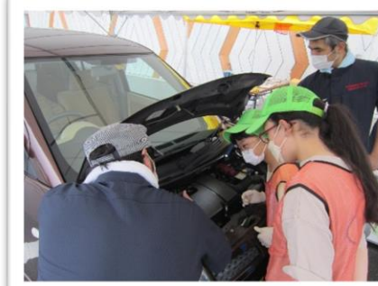
1. エンジンルーム、車まわりを点検

当日、会場である陸前高田市コミュニティーホールには地元の小学生約40人が集まり、18業種の地域企業の参加により、職業体験→仮想通貨の交付→消費体験 という流れでイベントが進められました。